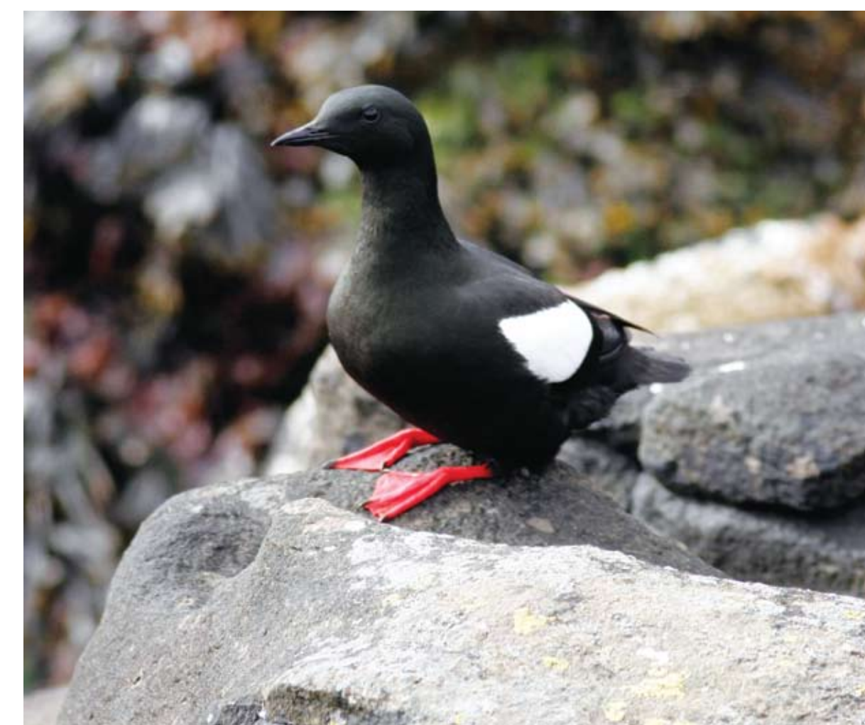
Teista. Cepphus grylle . Black Guillemot