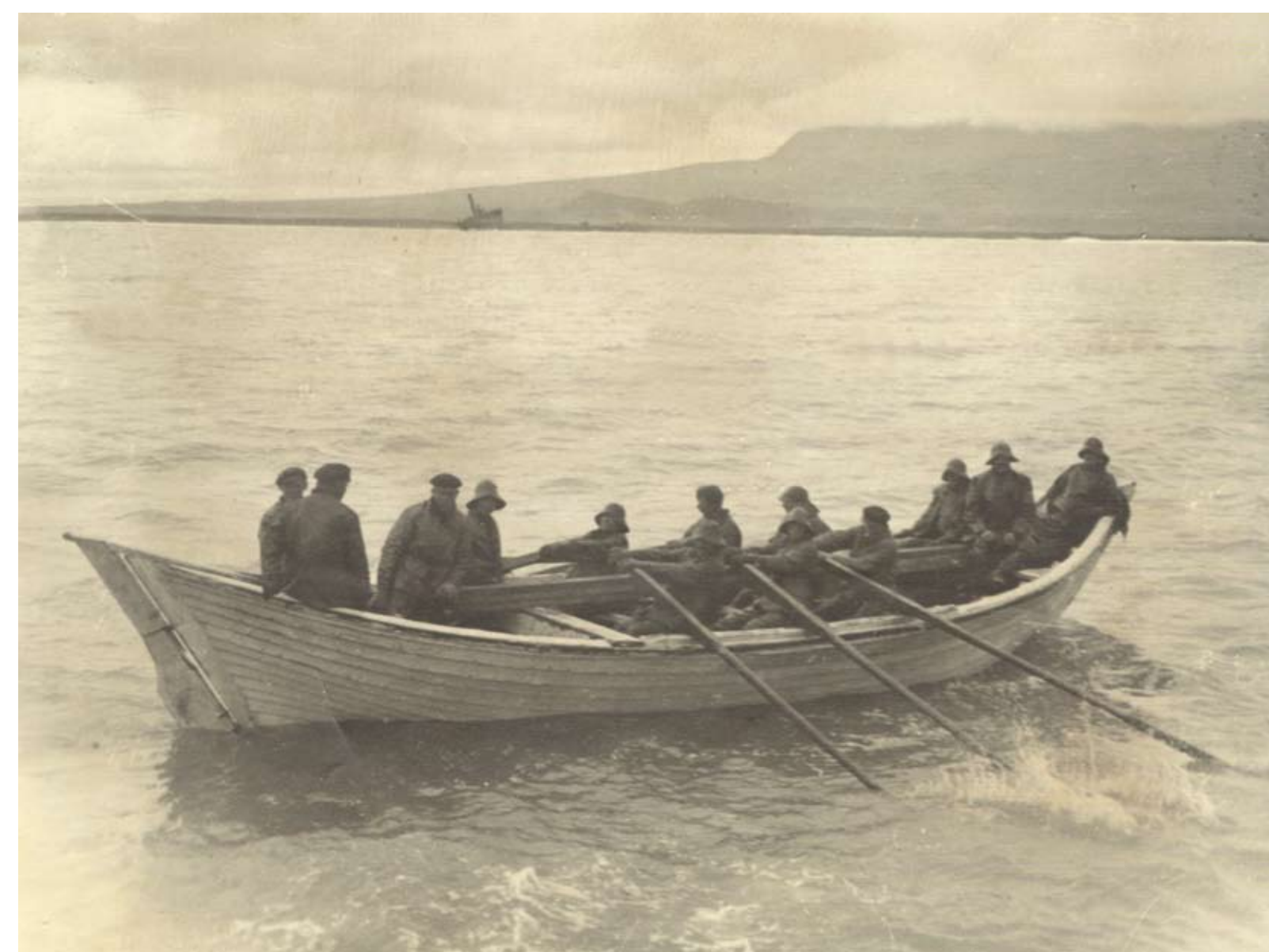
Héraðsskjalasafn A. Skaft

Hafnartangi has its place in world history. Around 1940 the British army began building stations on the east coast of Iceland and around the same time they started to build barracks and a guarding station at Hafnartangi. Then in 1942 the US army built a radio beacon, but the US army was stationed at Hafnartangi until 1944. There were 22 barracks at the station and there was no road out here and they had to drive on the beach during low tide. You can still see the ruins of the barracks and two big chimneys. The army also had a bigger chimney to fire up, to misguide the enemy planes who were looking for targets.