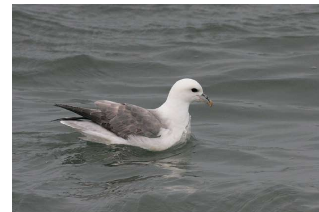
Fýll. Fulmarus glacialis . Fulmar.