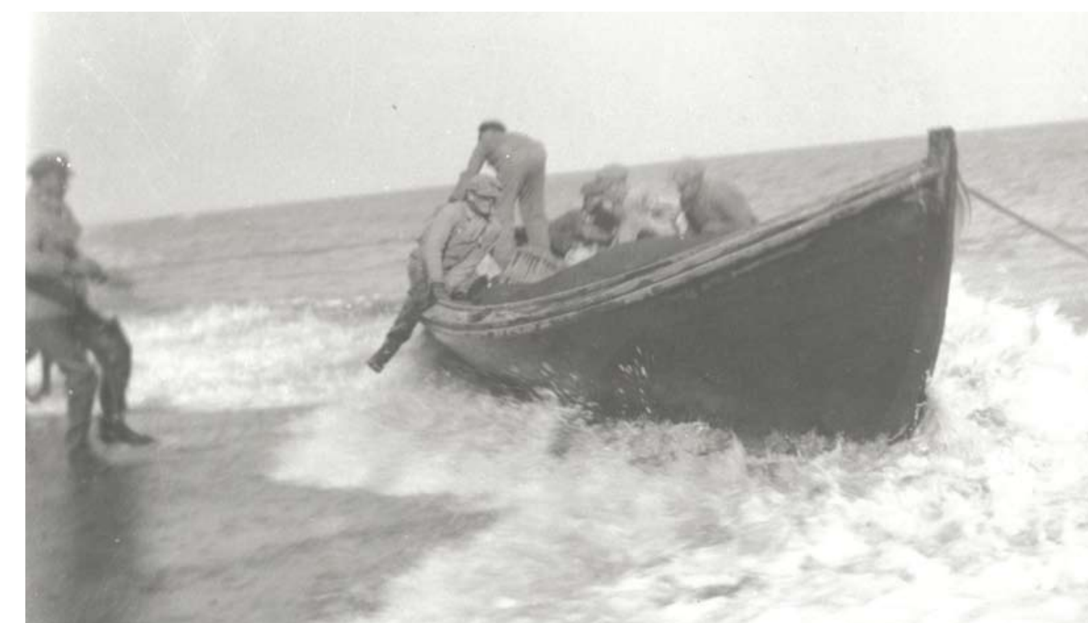
Brimlending í sandfjöru