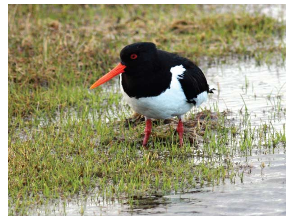
Tjaldur. Haematopus ostralegus . Oystercatcher