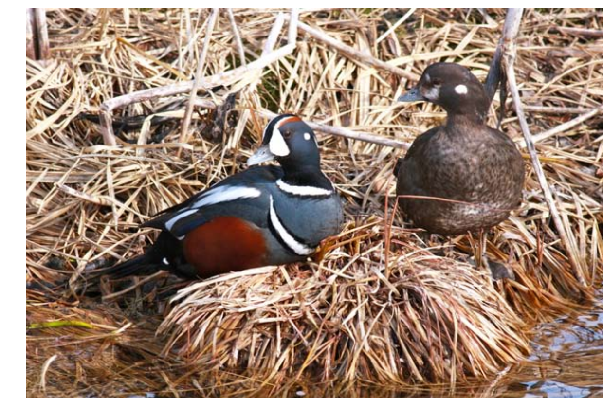
Straumönd. Histrionicus histrionicus . Harlequin Duck