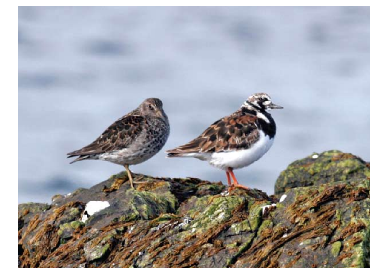
Sendlingur. Calidris maritima . Purple Sandpiper og Tildra.