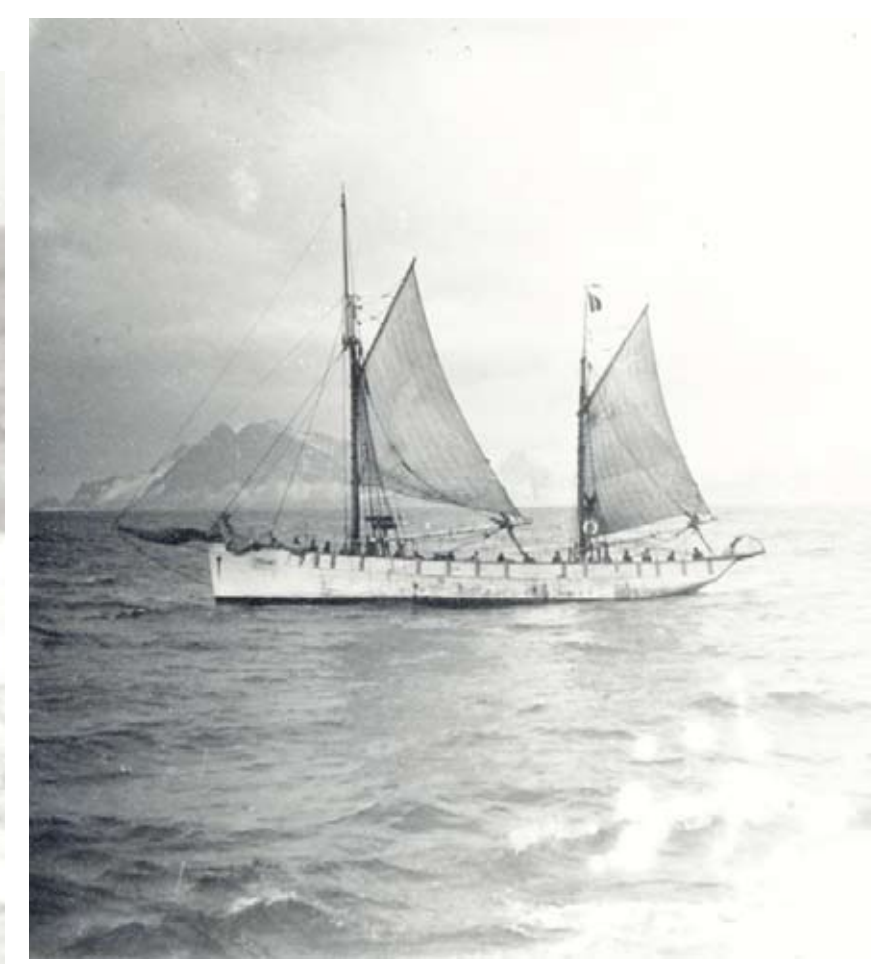
Frönsk skúta fyrir utan Horn