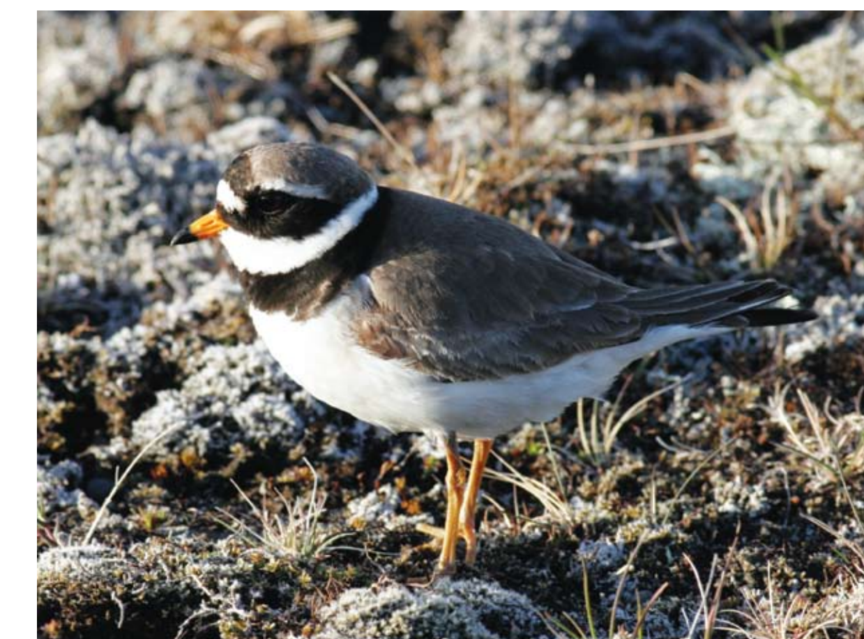
Sandlóa. Charadrius hiaticula . Ringed Plover

At Horn we have diversity of birds, and here in this area we can find numerous sorts of birds, regional and migratory: